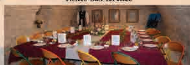
Location de l'Arsenal

Pour plus d'informations : Port. : 06 31 15 00 36 reservation@vieux-chatel.fr www.chatel-medieval.com