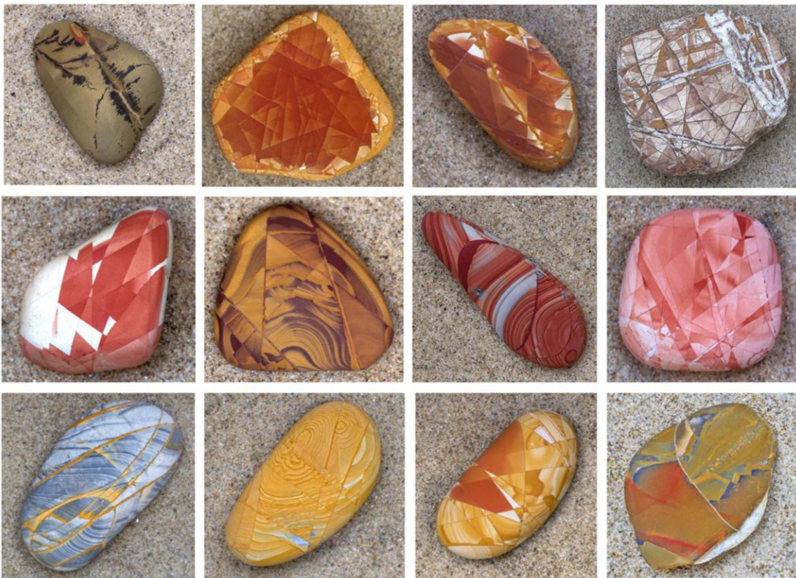
Figure 1. Les giottoli sont des galets (ciottoli en italien) de calcaire, dépassant rarement 10 centimètres qui, après abrasion de leur patine, présentent des couleurs intenses rappelant la palette du peintre Giotto. Ils ont été récemment découverts en Toscane par Roberto Mari, auteur des photos.