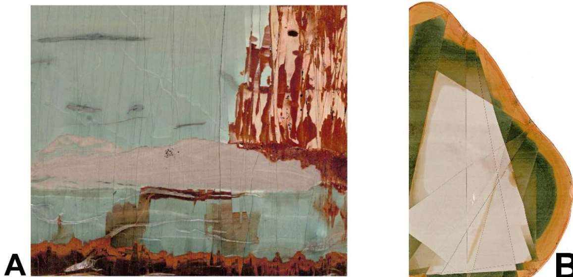
Figure 4. A : Paésine « cité lacustre », comme une peinture surréaliste, Florence (Toscane). B : Calda Verde, comme une peinture abstraite, Arno (Toscane).

plus récentes concentriques aux galets, superposées aux plus anciennes guidées par les fractures. Un plaisir des yeux.