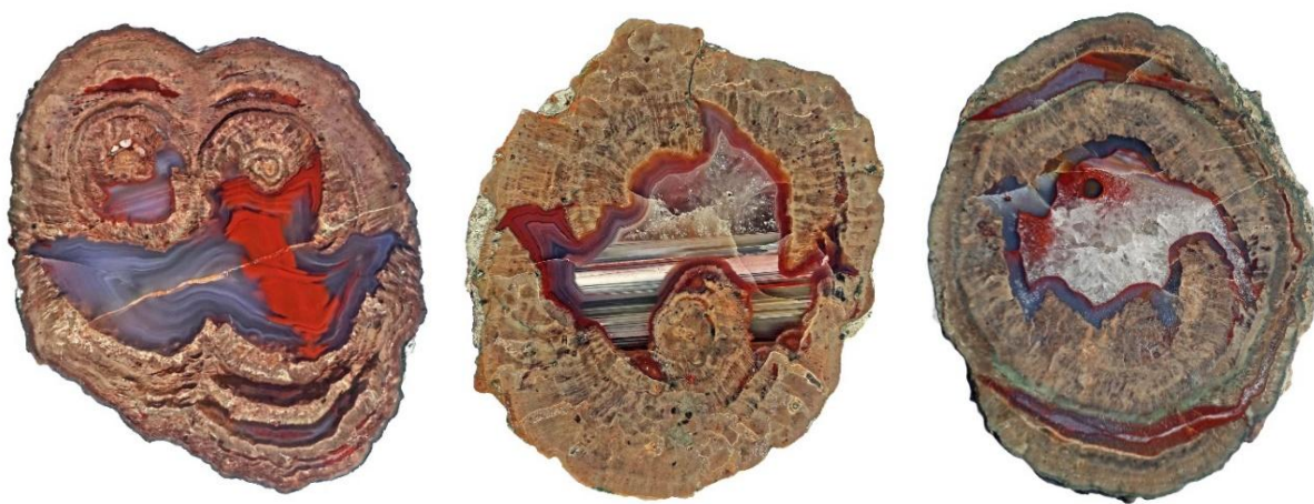
Figure 2. Les lithophyses (littéralement, gouttes de pierre) de l'Esterel (Var) sont des agates remplissant des nodules de laves. Leur diversité laisse libre cours à l'imagination.

Ainsi, à la différence des magnifiques collections exposées par Terrae Genesis, celle qui vous est présentée n'est pas fondée sur son intérêt minéralogique (il s'agit d'ailleurs plutôt de roches), mais sur son pouvoir évocateur. Selon sa subjectivité, l'imaginaire de chacun pourra y ressentir des inspirations différentes. Beaucoup plus modeste (60 pièces environ), cet ensemble, rassemblé lors de mes voyages professionnels (Chine pour l'essentiel) ou de mes recherches personnelles (France et Italie) a pour mérite de compléter celles de Roger Caillois par la représentation importante des roches carbonatées comme les calcaires dendritiques et les marbres paysagers chinois, ou les giottoli récemment découverts en Toscane ( Figure 1 ). Concernant les roches siliceuses, on notera les nombreuses lithophyses de l'Esterel ( Figure 2 ). Quelques formes minérales particulières comme une mousse, une rose de barytine et une pierre de chrysanthème, complètent cette collection.