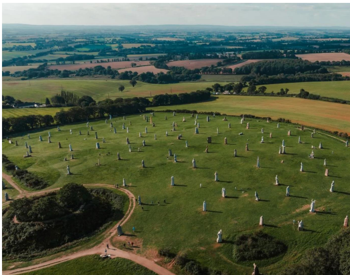
Vue partielle du site par drone