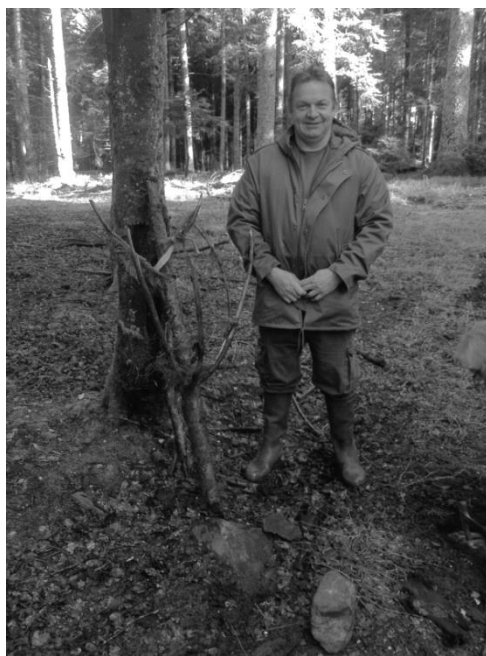
Le découvreur et sa découverte